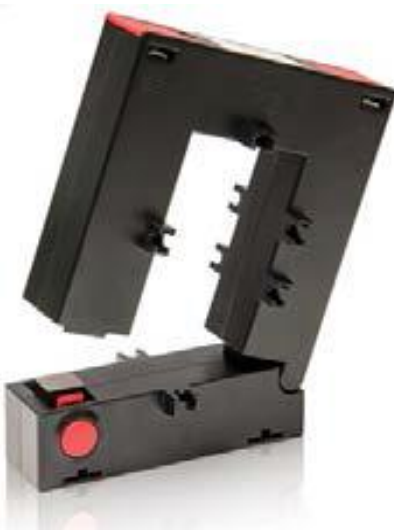
Рисунок 7 - Общий вид трансформаторов модификаций CS8S, CS12S