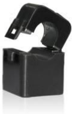
Рисунок 3 - Общий вид трансформаторов модификаций CS05S, CS1S, CS2S