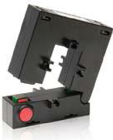
Рисунок 6 - Общий вид трансформаторов модификации CS4S