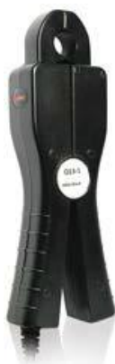
Рисунок 4 - Общий вид трансформаторов модификации CS1H