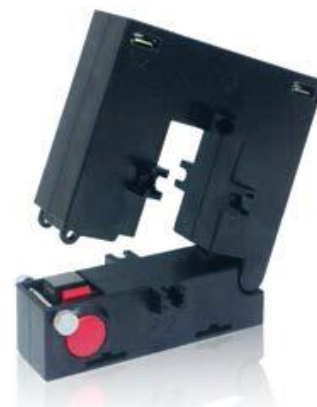
Рисунок 5 - Общий вид трансформаторов модификации CS2SL