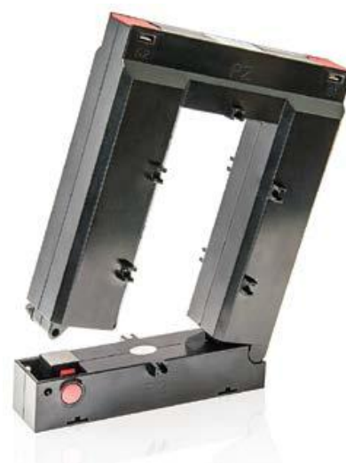
Рисунок 8 - Общий вид трансформаторов модификаций CS20S, CS30S