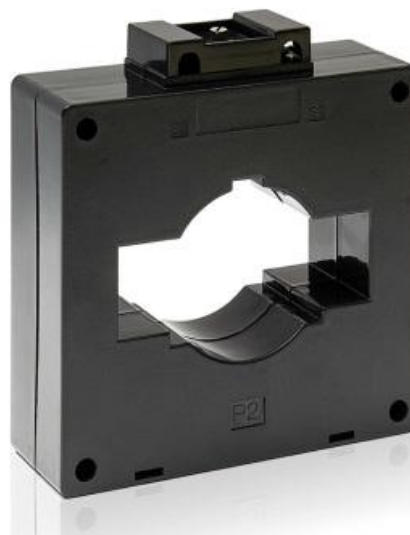
Рисунок 2 - Общий вид трансформаторов модификации CS8