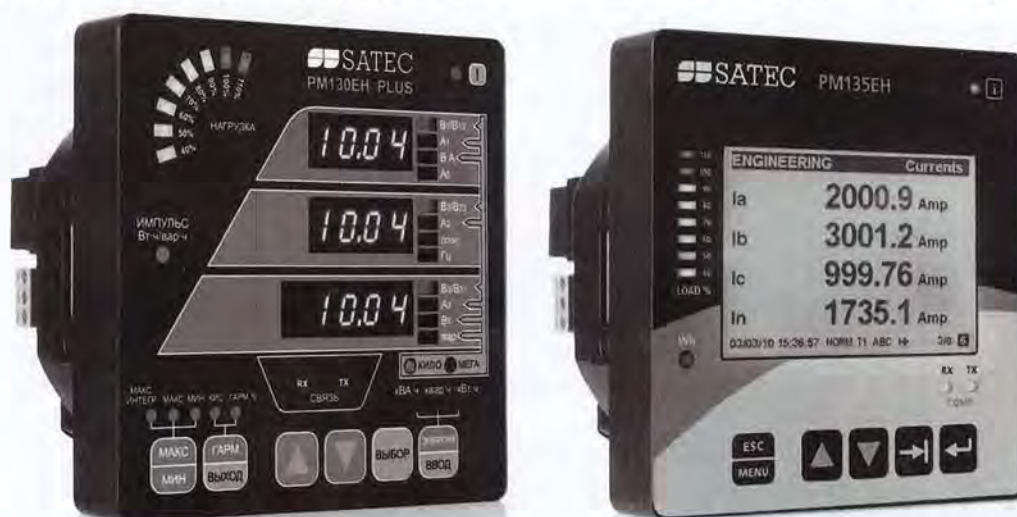
Рисунок 1 - Внешний вид измерителей модификаций PM130EH Plus и PM135EH

Конструктивно измерители выполнены в ударопрочном пылезащитном корпусе и представляют собой цифровые приборы, внешний вид которых представлен на рисунке 1.