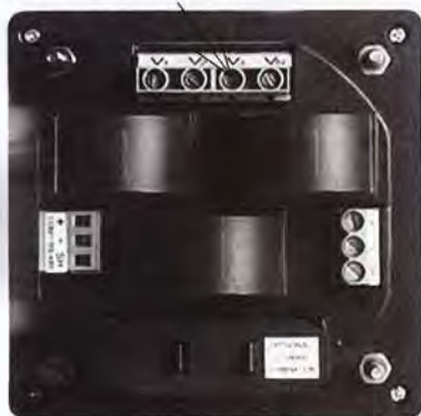
Рисунок 2 - Место пломбирования от несанкционированного доступа (показано стрелкой)

Измерители выпускаются под торговой маркой фирмы SATEC, Израиль.