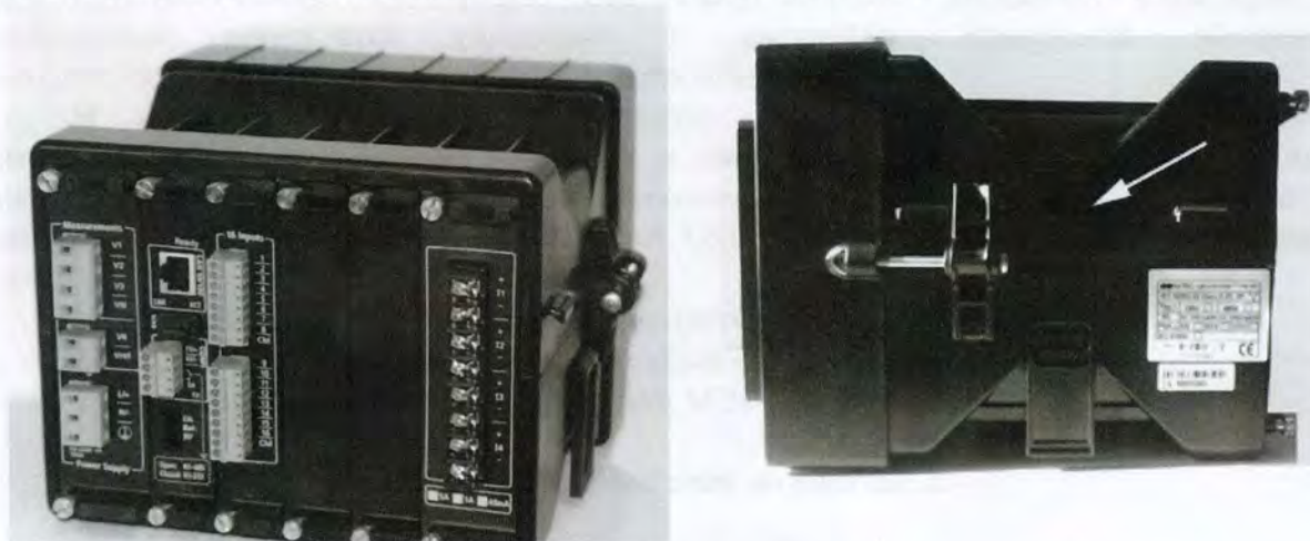
Рисунок 1 - Внешний вид приборов для измерений показателей качества и учета электрической энергии SATEC PM180, стрелкой показано место нанесения знака утверждения типа

Конструктивно измеритель выполнен в ударопрочном пылезащитном корпусе и представляет собой портативный цифровой прибор, внешний вид которого с указанием схемы пломбирования от несанкционированного доступа представлен на рисунке 1.