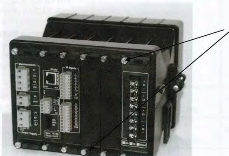
Рисунок 2 – Крепёжные винты со специальными головками (показаны стрелками), позволяющие осуществлять пломбирование измерителя.

Схема пломбирования измерителя показана на рисунке 2.